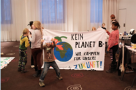
Highlight Kindertreff Stuttgart: Radio- Beitrag