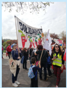
1. Mai Demo: Die Roten Peperoni sind in Stuttgart, Saarbrücken und Freiburg auf den Straßen!