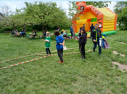
Morgens: Spiele- und Spaß-Stationen auf dem jährlichen Kinderfest