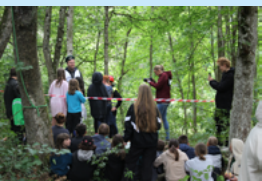
Highlight Ferienlager: Waldbeset- zung