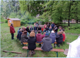
Abends: Die Roten Peperoni feiern ihren 30. Geburtstag