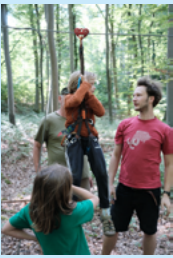
JUN. Das Pfingstcamp: Vier superspannende Tage im Wald mit Lagerfeuer, Zel- ten und Seilbahn bauen!