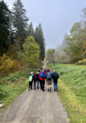
Die Herbstfreizeit: Kochen, Backen, Spielen, Basteln und Halloweenparty mit Geisterbahn