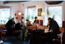
Los geht's! Volxküche im Linken Zentrum Lilo Herrmann